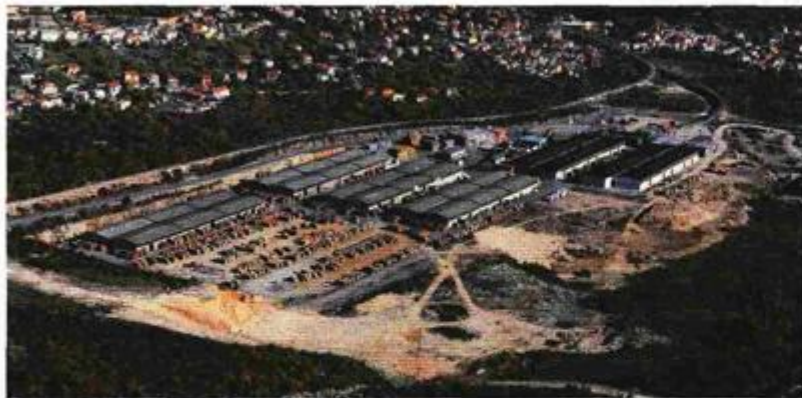
Projekt ima najveći značaj za kontejnerski promet riječke luke