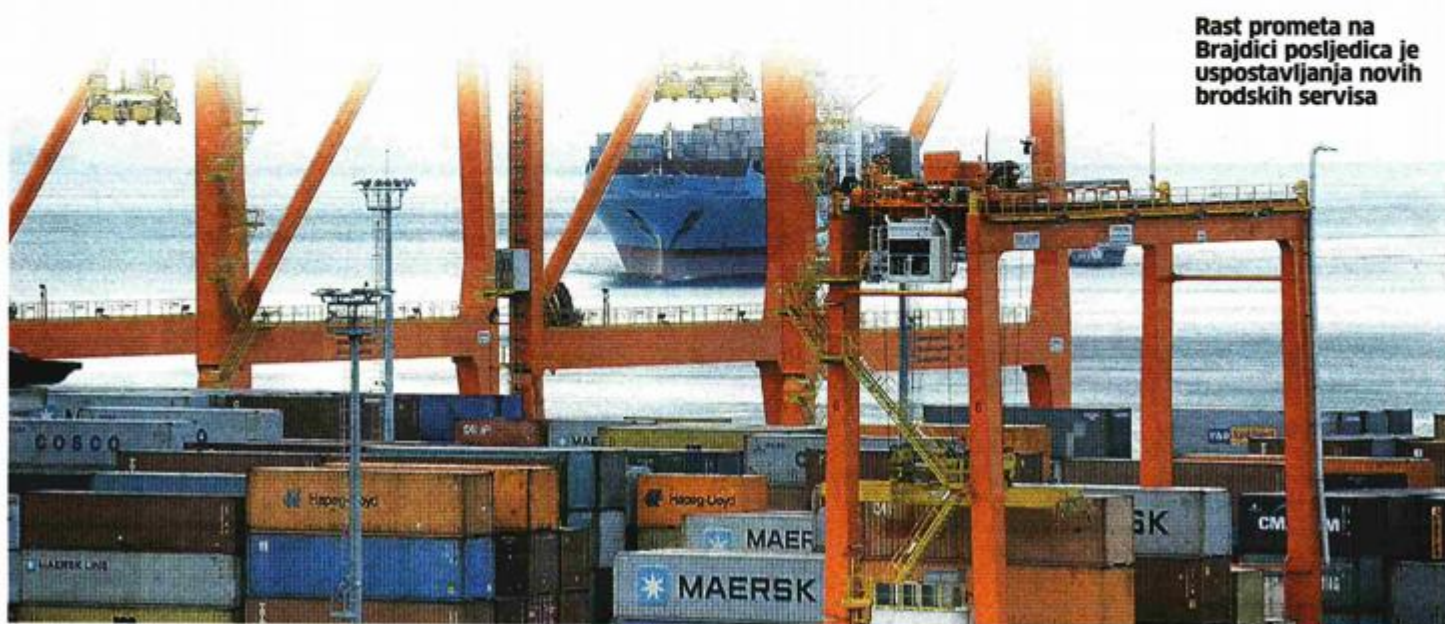
Rast prometa na Brajdici posljedica je uspostavljanja novih brodskih servisa