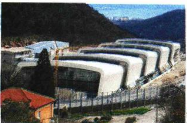
JGL svoj pogon na Svilnom, popularano nazvan Pharma Valley, planira otvoriti sredinom godine