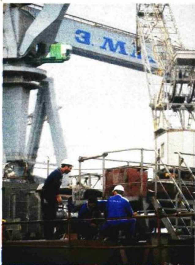
S teglenica »3. maj« konačno prešao na brodove, prihodi rastu pa bi u 2015. trebali rasti s 420 na 900 milijuna kuna

Najveći dio od prodane »pameti«, gotovo 348 milijuna, odnosio se na znanstveno istraživanje i razvoj