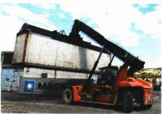
Početak građevinskih radova na terminalu Škrljevo očekuje se paralelno sa završetkom dokapitalizacije